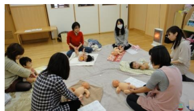
ベビーマッサージの様子